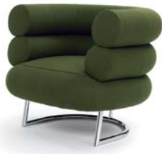
Europost grün green