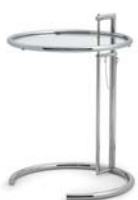
ADJUSTABLE TABLE E 1027 1927