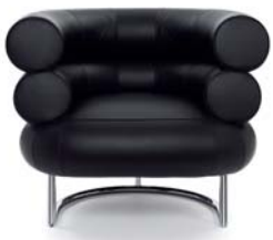
Leder schwarz leather black

Estructura de tubos de acero cromado. Asiento de marco en madera de haya con bandas de goma. Acolchado: poliuretano con espuma de poliéster. Tapicería de tela o cuero. Detalles y colores ver lista de precios.