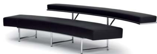
MONTE CARLO 1929